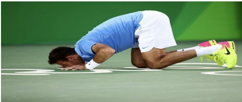
Delpo en los Juegos Olímpicos 2016.

Y como se menciona anteriormente, el cansancio, la felicidad, esfuerzo, compromiso y respeto no siempre lleva a que el beso sea hacia una persona. En este caso mostramos al argentino múltiple ganador Juan Martín del Potro luego de derrotar de a Rafael Nadal en el partido de semifinales de singles masculinos.