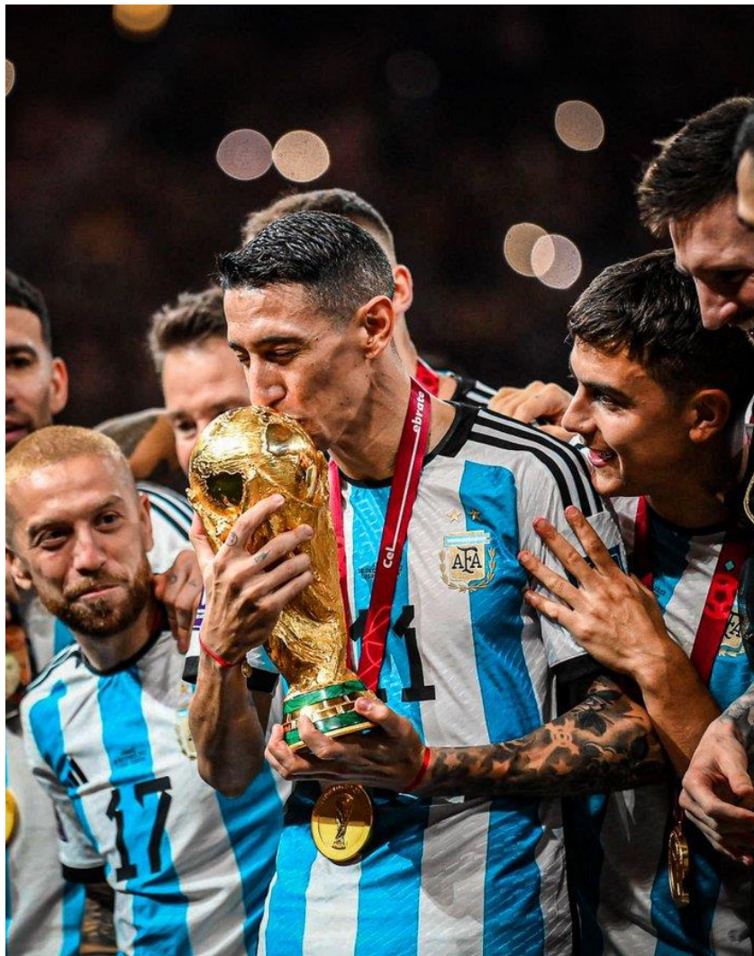
Ángel Di María, el Fideo, besando merecidamente la copa siendo uno de los más goleadores.