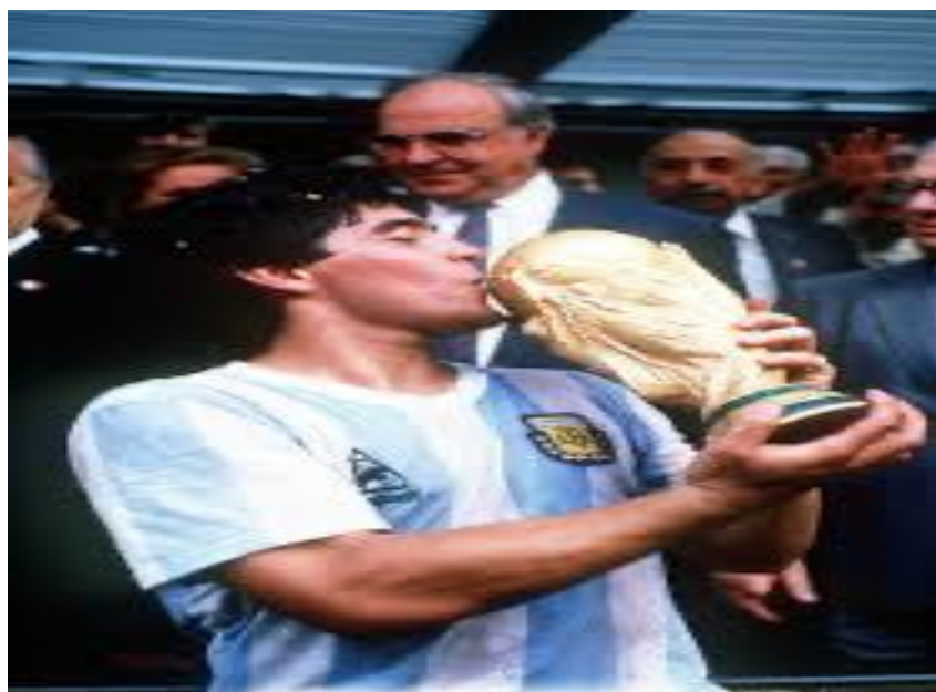
Maradona campeón del mundo en 1986.