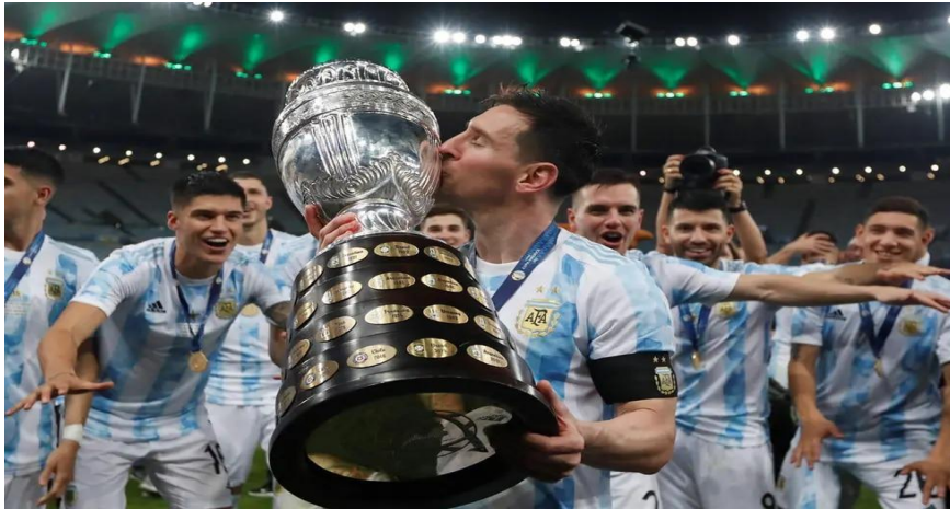
Messi besando La Copa América, año 2021.