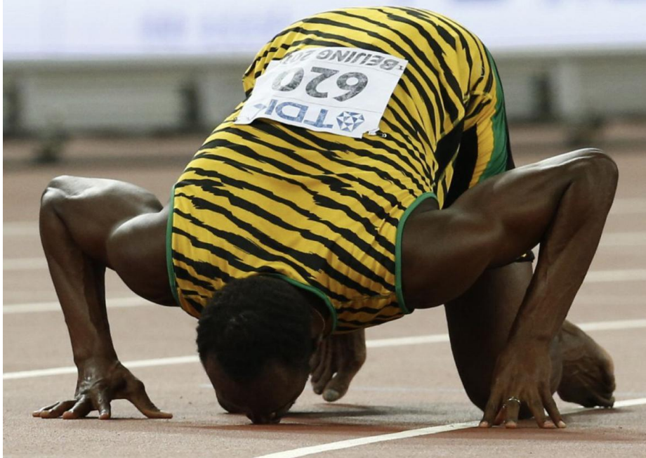
Usain Bolt, Mundial de 2015, China.

Y como se menciona anteriormente, el cansancio, la felicidad, esfuerzo, compromiso y respeto no siempre lleva a que el beso sea hacia una persona. En este caso mostramos al argentino múltiple ganador Juan Martín del Potro luego de derrotar de a Rafael Nadal en el partido de semifinales de singles masculinos.