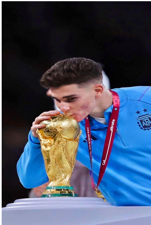
Julián Álvarez, La Araña.