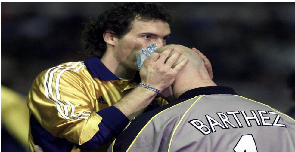
El famoso beso convertido en símbolo, protagonizado por Laurent Blanc y Fabien Barthez. Año 1998.

En modo de ritual el central de Francia le besaba la frente calva al arquero. Al parecer funcionó ya que Francia salió campeona ese año (1998). Llegó a tal punto este “ritual” que el beso se convirtió en un símbolo que incluyó al presidente francés Jacques Chirac.