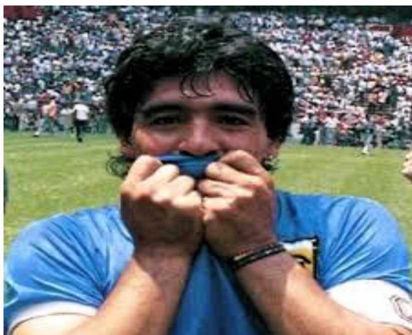
El Pelusa besando la camiseta que más amo.