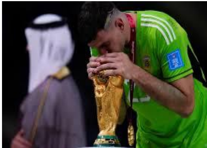
Emiliano Dibu Martínez, el mejor arquero del mundo, besando la copa. 2022, Qatar.