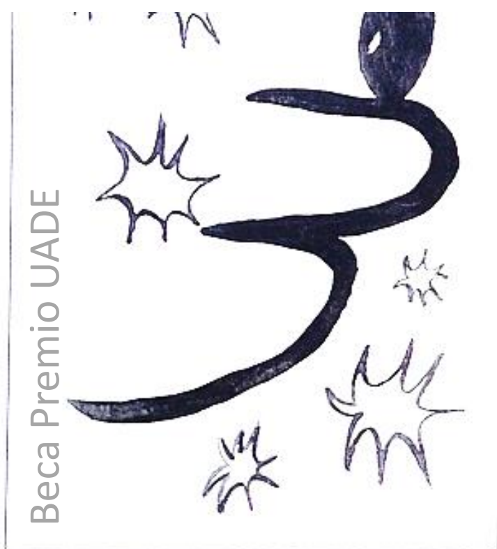
Der schwarze Punk

“En la residencia Vorwerk Stif, al finalizar mi estadía, se iba a realizar la exposición colectiva anual que se hace en forma de festival de tres días donde circula un gran público, para que los artistas participantes indaguen en la performance, algo que yo nunca había hecho, pero tome tal invitación como una oportunidad de lanzarme a lo desconocido. El resultado fue muy bueno, hice una performance en la cual interactuaba con el público, consistía en una puesta en escena donde yo era un oráculo con un mazo de cartas dibujadas y pensadas por mí, de a una persona se iban sentando y escribiendo una pregunta acerca de su futuro, al tomar 3 cartas al azar encontraban la respuesta enigmática que se formaba al ver los tres dibujos misteriosos que aluden a personajes lugares y costumbres de Hamburgo.”