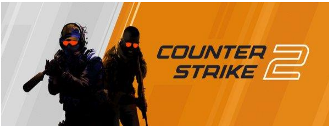
Portada del Twitter oficial de Counter Strike.

El Counter es uno de los juegos más importantes en los E-Sports y después de una década recibirá una actualización gratuita que va a contar con varias mejoras.