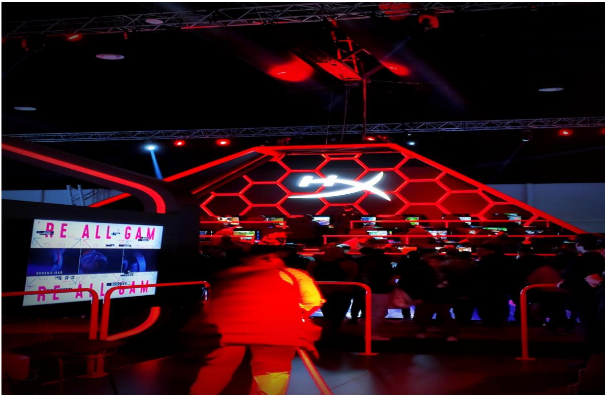
Stand de Hyperx

En cuanto a marcas, se destacaron los stands de Philips Hu, Corsair, El Gato, HyperX. El detalle del evento fue que Sony por primera vez mostró al público la nueva línea gamer.