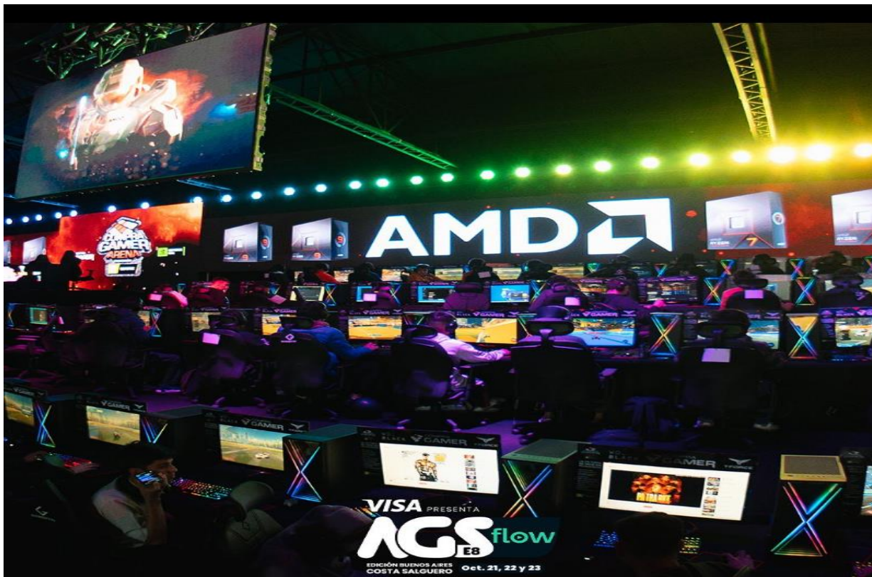
Stand de AMD

En 2022, la sede fue Costa Salguero. Significó la octava edición del certamen.