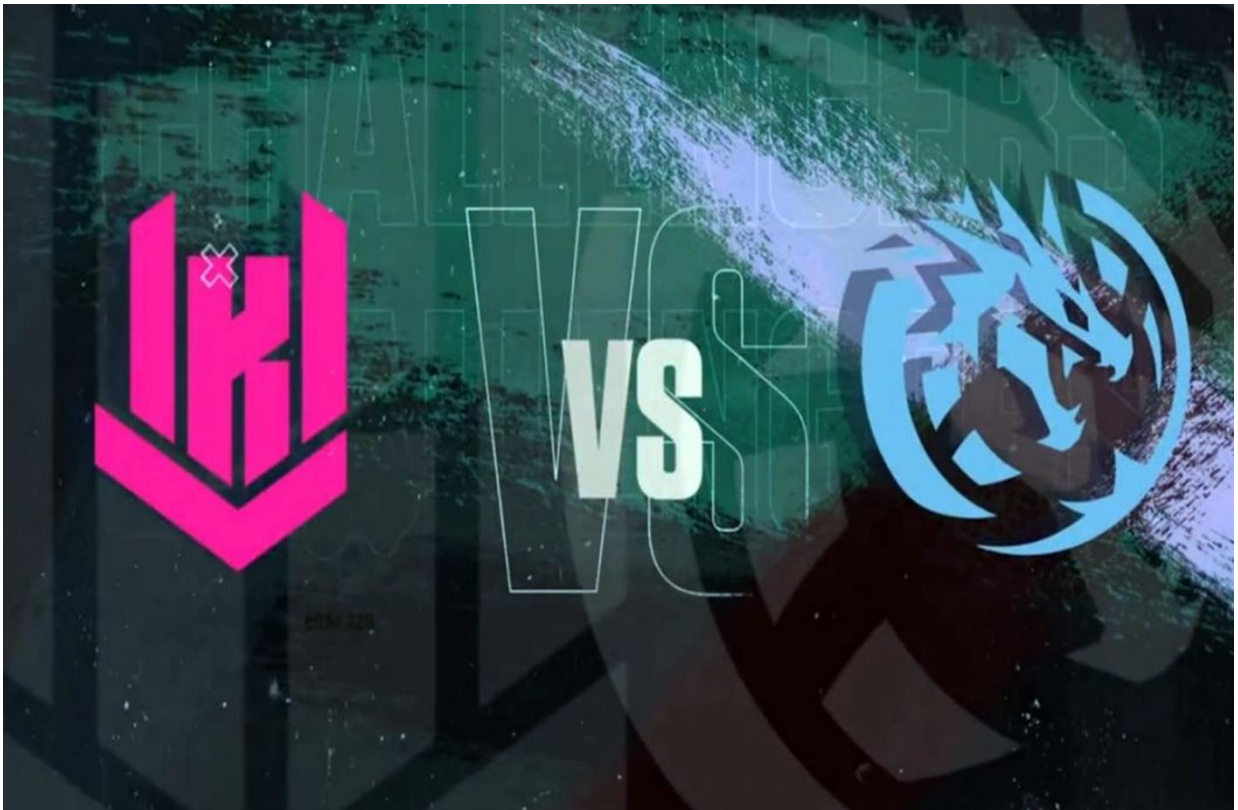
Banner del encuentro de KRU vs KOI

La AGS contó con la presencia de los equipos más importante del país KRU, 9Z Team, Furious Gaming y KOI entre otros.